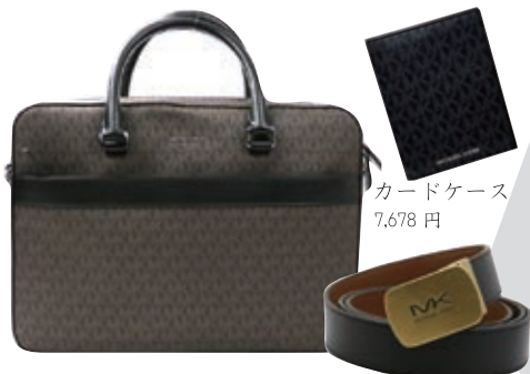
ブリーフケース 36,080円