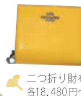
二つ折り財布 各18,480円〜