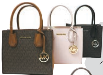
ハンドバッグ 各26,180円

アメリカのデザイナー「マイケルコース」が1981年にアメリカ・NYにて生み出したブランドです。