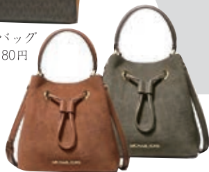
ショルダーバッグ 各27,280円

マイケルコースは幅広い年代に好まれています。その理由としてシンプルかつ、デザイン & カラーバリエーションが豊富で、自分に似合うアイテムや普段使い・ドレスアップ時どちらも使いやすいアイテムが見つかるからだと言われています。