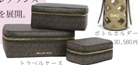
トラベルケース 34,980円