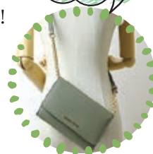
マイケルコースフォンウォレット 各12,980円〜 ウォレットバッグ 23,980円