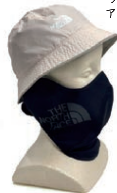
ハット ¥6,050 マスク ¥7,480

フルフェイスカバーできる！ アウトドア用で人気マスク★ 冬はスキーマスクとして 使えます♪