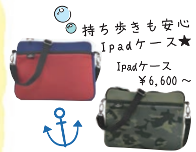
持ち歩きも安心 iPad ケース★ iPad ケース ¥6,600~