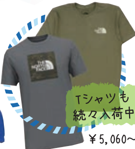
Tシャツも 続々入荷中 ¥5,060~