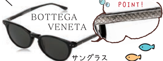
BOTTEGA VENETA サングラス ¥41,800