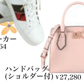
ハンドバッグ (ショルダー付) ¥27,280