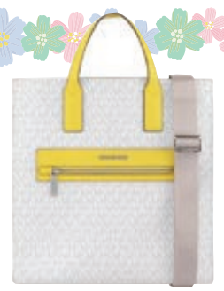
トートバッグ ¥32,780 (ショルダー付)