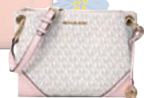
ショルダーバッグ ¥32,780