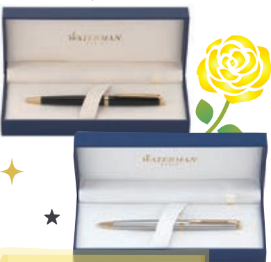
ボールペン ウォーターマン 7,700円~