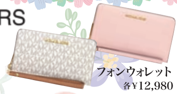
フォンウォレット 各¥12,980