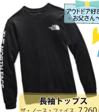
アウトドア好きな お父さんへ