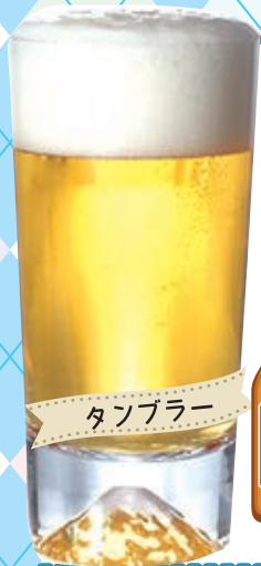
田島窯 江戸硝子 富士山グラス 各5,500円