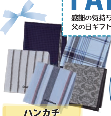
ハンカチ オロビアンコ 各550円