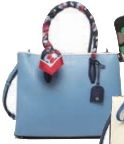
ハンドバッグ (ショルダー付) 各¥36,080

大人気 2トップブランドの新商品続々入荷中♪ カラーアイテムで気分も明るく華やかに