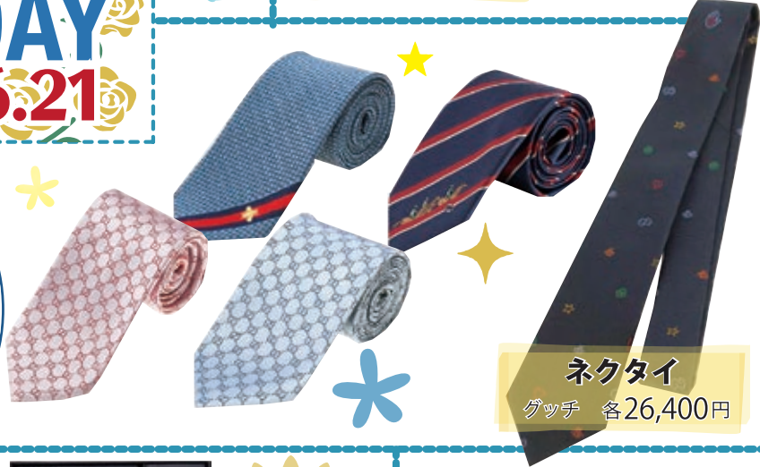
ネクタイ グッチ 各26,400円