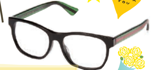
メガネフレーム グッチ 25,800円