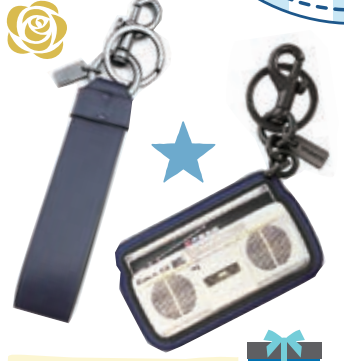
キーリング コーチ 各7,678円