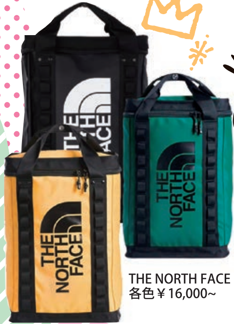
THE NORTH FACE 各色 ¥16,000~