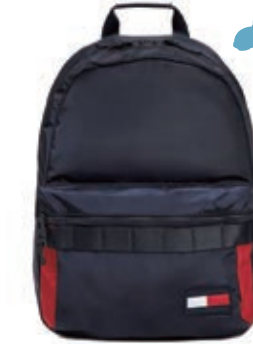
サイズ:約 W30×H41×D14cm ¥12,000