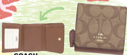
COACH サイズ:約 W10×H8×D3cm ¥12,800