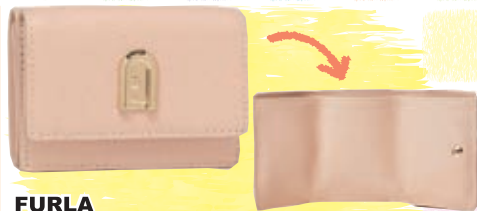
FURLA サイズ:約 W9.5×H7×D3.5cm ¥15,800