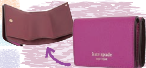
KATE SPADE サイズ:約 W9.5×H6.5×D3.5cm ¥7,800