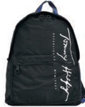
サイズ:約 W30×H41×D14cm ¥11,800