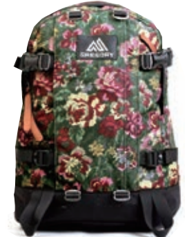
サイズ:約 W25.5×H48×D17.5cm ¥14,800