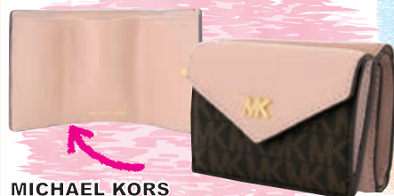
MICHAEL KORS サイズ:約 W9.5×H6.5×D4cm ¥14,800