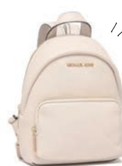
サイズ:約 W18×H25×D7.5cm ¥22,800