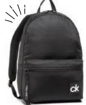
サイズ:約 W26×H42×D11cm ¥16,000