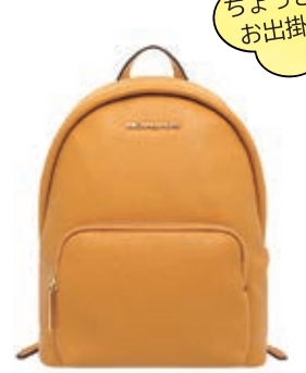
サイズ:約 W18×H24×D8.5cm ¥25,800