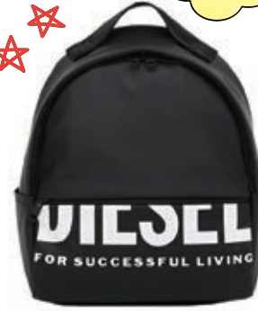
サイズ:約 W10.5×H26×D32.5cm ¥16,800