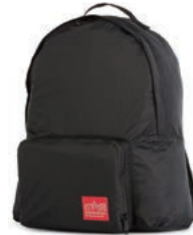
サイズ:約 W29×H40×D12cm ¥11,600