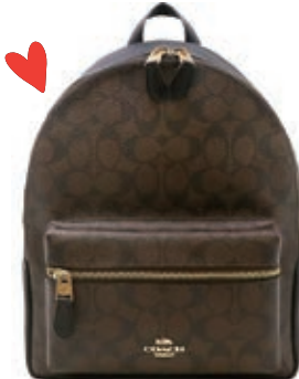
サイズ:約 W26×H33×D13cm ¥22,800