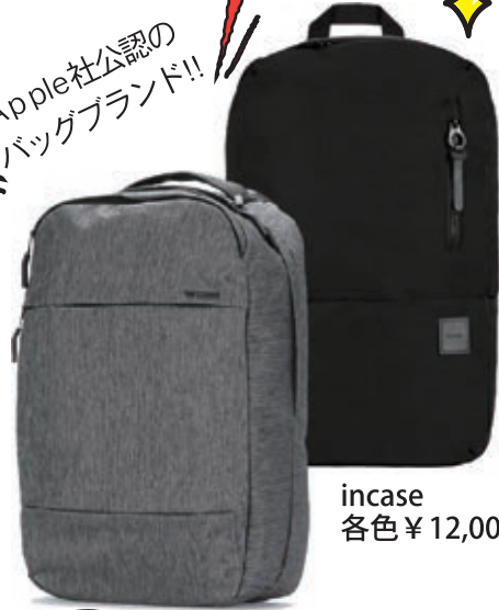
incase 各色 ¥12,000~